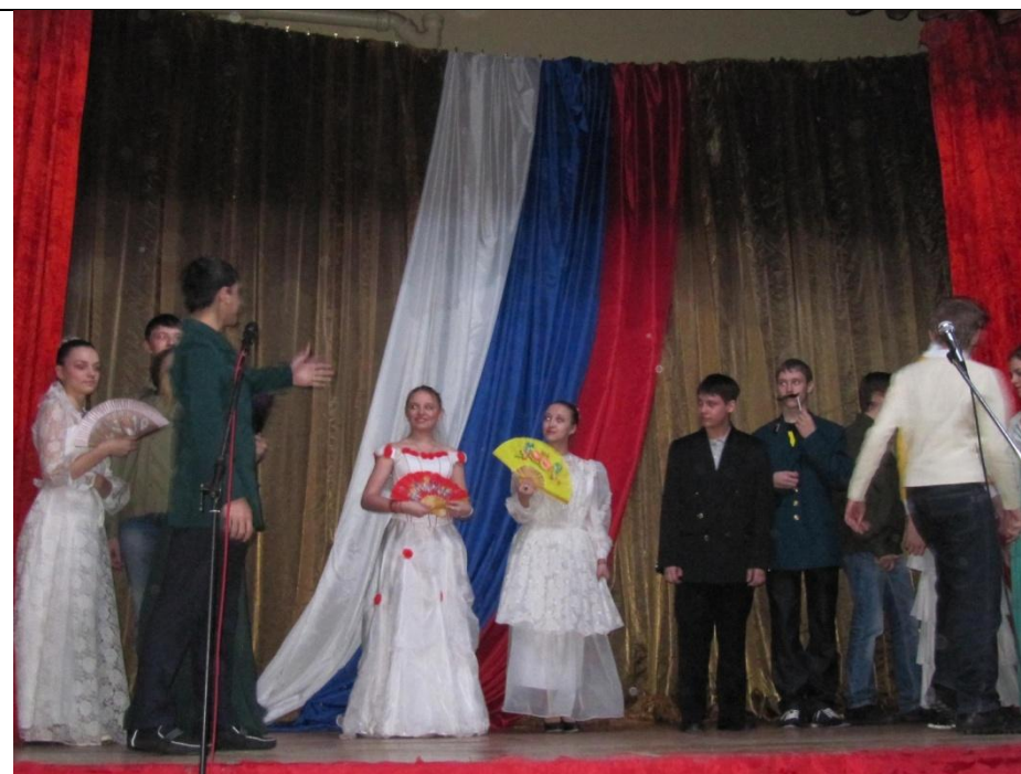
Н.В.Гоголь «Ревизор». Поздравление Городничего.