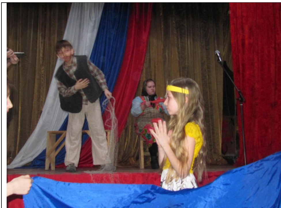
А.С.Пушкин «Сказка о рыбаке и рыбке»