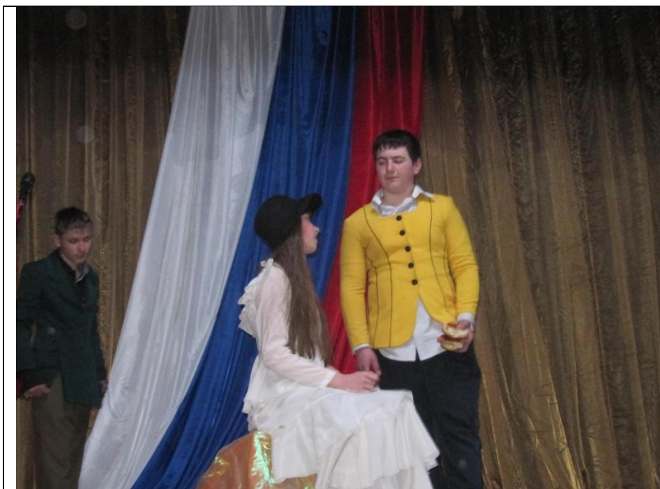
Д.И. Фонвизин «Недоросль». Тришкин кафтан.