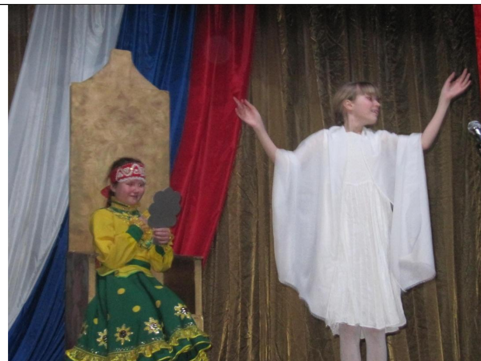
А.С.Пушкин «Сказка о мертвой царевне и семи богатырях»