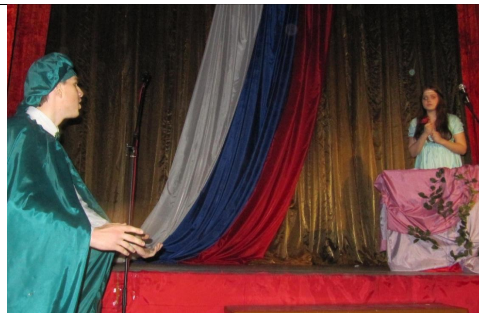
У.Шекспир «Ромео и Джульетта». Сцена на балконе.